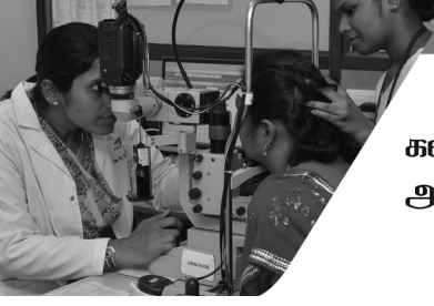
கண் நீர் அழுத்தம்